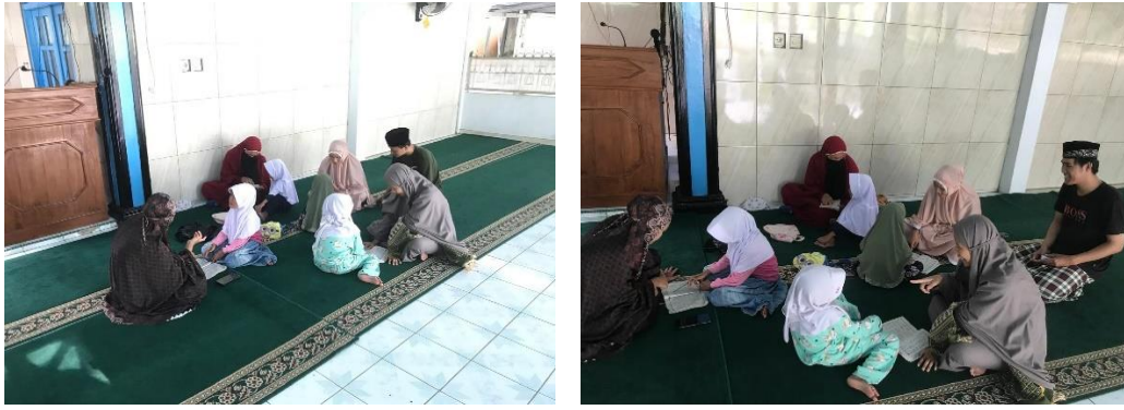
Gambar 1. Kegiatan ibadah di Masjid

Program mengajar mengaji di TPQ Nurul Anwar dan mengajar mengaji di Sekretariat 66. Maksud dari kata mengaji adalah proses belajar membaca Arab bagi anak-anak dengan dibimbing oleh para ustadz/ustadzah dalam sebuah majlis ta'lim. Program mengajar mengaji dilakukan mulai tanggal 15 juli, karena sebelum tanggal tersebut anak – anak mengaji diliburkan dari kegiatan mengaji di TPQ Nurul Anwar. Sehingga anggota kelompok 66 KKN UINFAS mengadakan belajar mengaji di sekretariat 66. Dan anggota kelompok 66 juga mengadakan belajar mengaji di masjid Al- Iman desa kayu arang. Setelah jadwal anak-anak mulai aktif kembali pada tanggal 15 juli, anggota kelompok 66 KKN UINFAS mulai aktif juga mengikuti kegiatan mengajar mengaji di TPQ Nurul Anwar. Adapun yang mengajar di TPQ Nurul Anwar adalah 4 ustadzah yang tinggal di desa kayu arang itu sendiri. Dan para pengajar di TPQ sangat merasa terbantu atas kehadiran kami dalam kegiatan mengajar mengaji. Anak-anak yang belajar mengaji disana pun juga ikut senang telah dibantu mengajar mengaji oleh pihak KKN kelompok 66 UINFAS Bengkulu. Setiap anggota kelompok 66 datang ke tempat belajar mengaji, anak-anak selalu menyambut dengan senyuman dan selalu menyalimi anggota kelompok 66 KKN UINFAS Bengkulu.