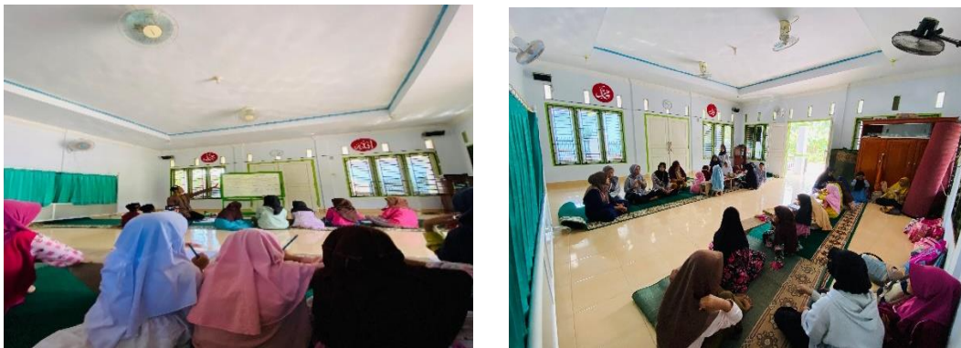
Gambar 2. Kegiatan membantu mengajar mengaji di TPQ Nurul Anwar

Program mengajar mengaji di TPQ Nurul Anwar dan mengajar mengaji di Sekretariat 66. Maksud dari kata mengaji adalah proses belajar membaca Arab bagi anak-anak dengan dibimbing oleh para ustadz/ustadzah dalam sebuah majlis ta'lim. Program mengajar mengaji dilakukan mulai tanggal 15 juli, karena sebelum tanggal tersebut anak – anak mengaji diliburkan dari kegiatan mengaji di TPQ Nurul Anwar. Sehingga anggota kelompok 66 KKN UINFAS mengadakan belajar mengaji di sekretariat 66. Dan anggota kelompok 66 juga mengadakan belajar mengaji di masjid Al- Iman desa kayu arang. Setelah jadwal anak-anak mulai aktif kembali pada tanggal 15 juli, anggota kelompok 66 KKN UINFAS mulai aktif juga mengikuti kegiatan mengajar mengaji di TPQ Nurul Anwar. Adapun yang mengajar di TPQ Nurul Anwar adalah 4 ustadzah yang tinggal di desa kayu arang itu sendiri. Dan para pengajar di TPQ sangat merasa terbantu atas kehadiran kami dalam kegiatan mengajar mengaji. Anak-anak yang belajar mengaji disana pun juga ikut senang telah dibantu mengajar mengaji oleh pihak KKN kelompok 66 UINFAS Bengkulu. Setiap anggota kelompok 66 datang ke tempat belajar mengaji, anak-anak selalu menyambut dengan senyuman dan selalu menyalimi anggota kelompok 66 KKN UINFAS Bengkulu.