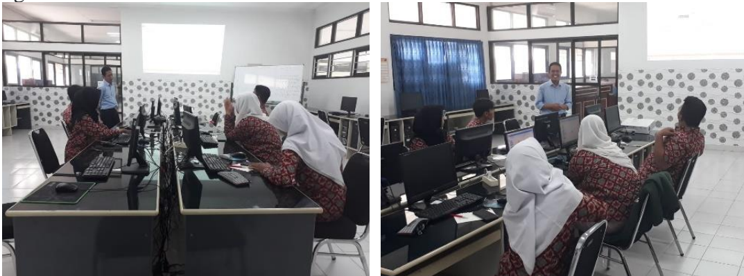
Gambar 5. Antusias Siswa dalam Menyimak Materi

Penyampaian dengan logika-logika yang ada di sekitar menjadi daya tarik. Antusias siswa dalam menyimak materi disajikan pada gambar 5 dan gambar 6, proses diskusi dengan nara sumber.