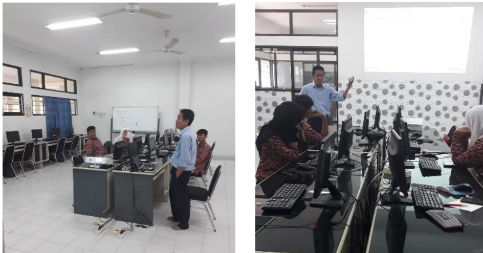
Gambar 6. Diskusi Nara Sumber dengan Peserta Pendampingan